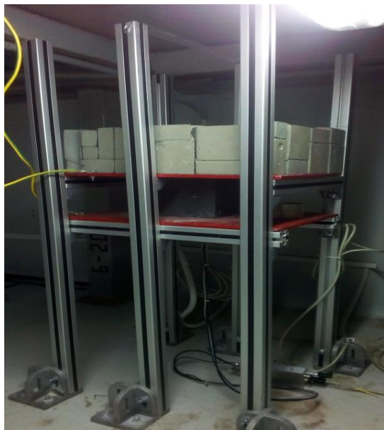
Рис. 3. Розташування детектора гамма-спектрометра.