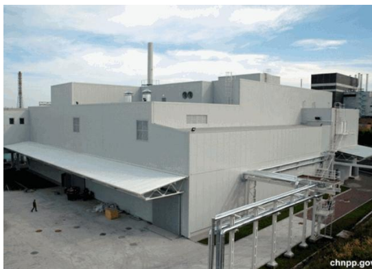
Рис. 1. ЗПТРВ на майданчику ЧАЕС.

Було зібрано і проаналізовано дані про об'єкти автоматизації та види діяльності, що здійснюються на ЗПТРВ згідно зі схемою (рис. 2) функціональних елементів засобів вимірювальної техніки (ЗВТ) та функціональних зв'язків системи радіаційно-технологічного контролю (СРТК). Ця схема наведена в інструкції [4].