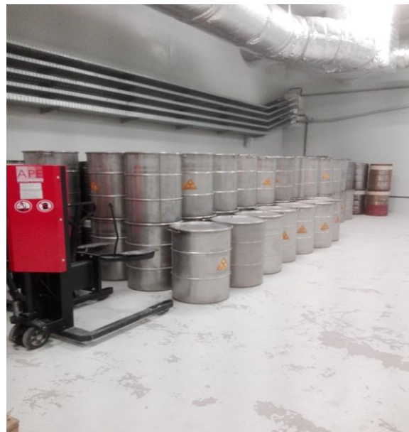
Рис. 4. Бочки для радіоактивних відходів.

ЗВТ системи DFF складається з чотирьох ВПД "VACU TEC 70090" (з електронікою для вимірювання потужності дози BFA-CQ1050), два з яких змонтовані на стіні у приміщенні П/127 праворуч від люків і реєструють потужність дози вимірюваного елемента перед завантаженням у бочку, а два блоки змонтовані навпроти один одного під люком із метою забезпечення неперевищення контрольного рівня.